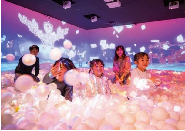
▲ZABOOM JOURNEY(ザブーンジャーニー)

「リトルプラネット イオンモール ハドン」では、センシング技術を駆使した光と音の冒険型ボールプール「ZABOOM JOURNEY(ザブーンジャーニー)」、AR(拡張現実)技術を使った砂遊び「SAND PARTY!(サンドパーティ)」、紙に描いた乗り物の絵が3Dに変身してレースを繰り広げる「SKETCH RACING(スケッチレーシング)」など、日本で人気を集めるアトラクション9種をローカライズして提供します。