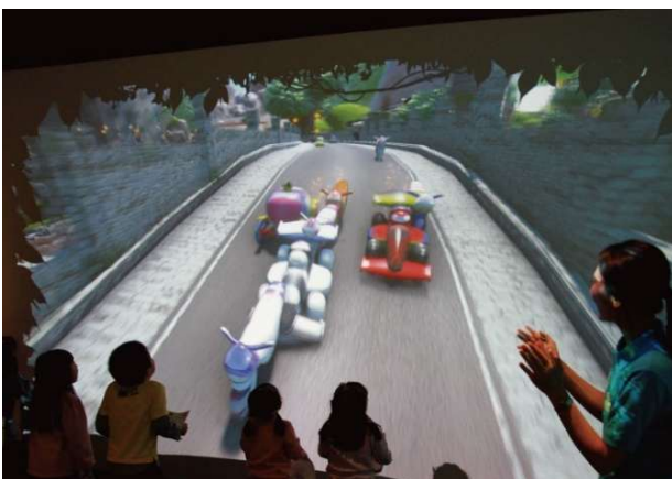
▲SKETCH RACING(スケッチレーシング)